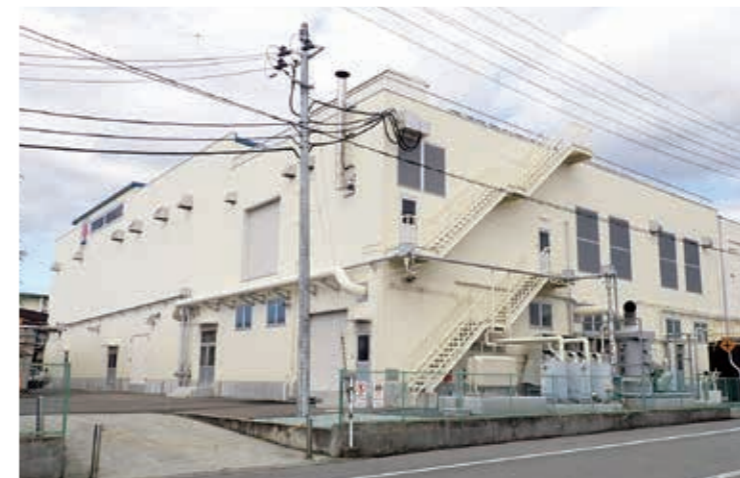
東ソー・クオーツ株式会社 山形製造所