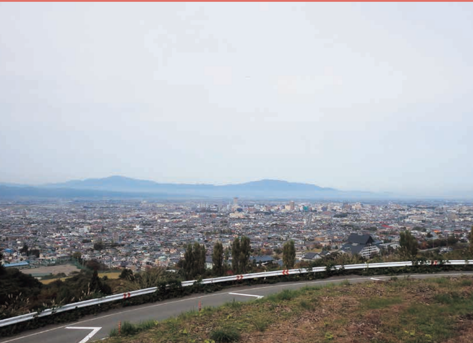
写真／西蔵王公園から山形市街を望む