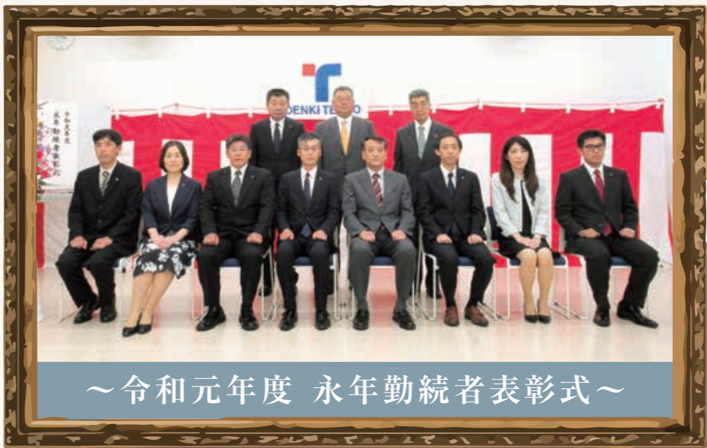
～令和元年度 永年勤続者表彰式～

7月17日に本大会議室において永年勤続者表彰式が行われ、7名の方が表彰されました。今後ますますのご健勝とご活躍を祈念いたします。今回は受賞された方々に懐かしい写真と共に思い出を語っていただきました。