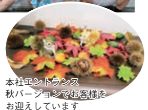
本社エントランス 秋バージョンでお客様をお迎えしています