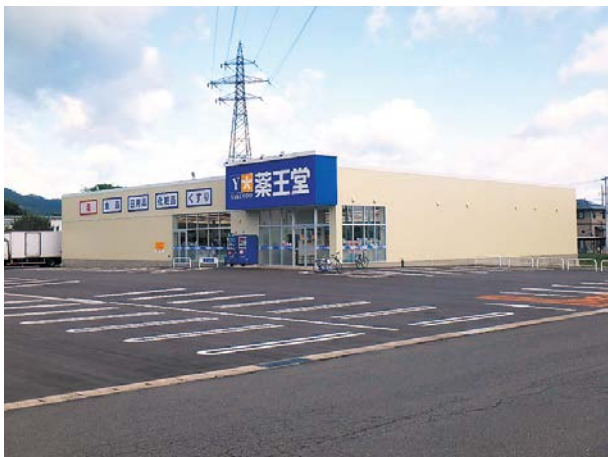
薬王堂米沢和泉町店様新築工事