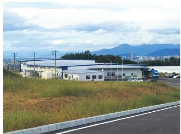
(株)伊藤製作所蔵王みはらしの丘工場様新築電気設備工事