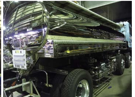
研修先工場内のタンクローリー