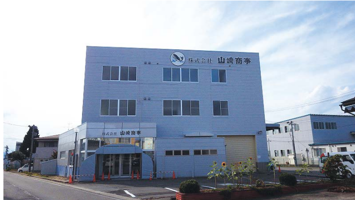
(有)山崎商事様 新社屋改修電気設備工事