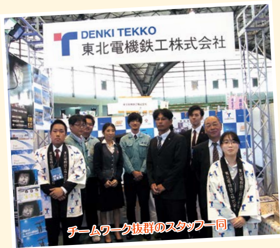
チームワーク抜群のスタッフ一同

少し気になったのが、TCI以外の展示を見学していく人が数える程しかいなかったことです。特許を取得した技術で目立っていくのは大変喜ばしいのですが、当社のアピールポイントは他にもたくさんあるので、来年以降は何かしらの工夫を加え、ブース全体を見てもらえるようになれば、産業フェアにおける当社のPR活動は盤石なものになるのではないかと思います。