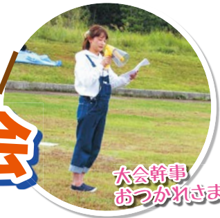
大会幹事 おつかれさま