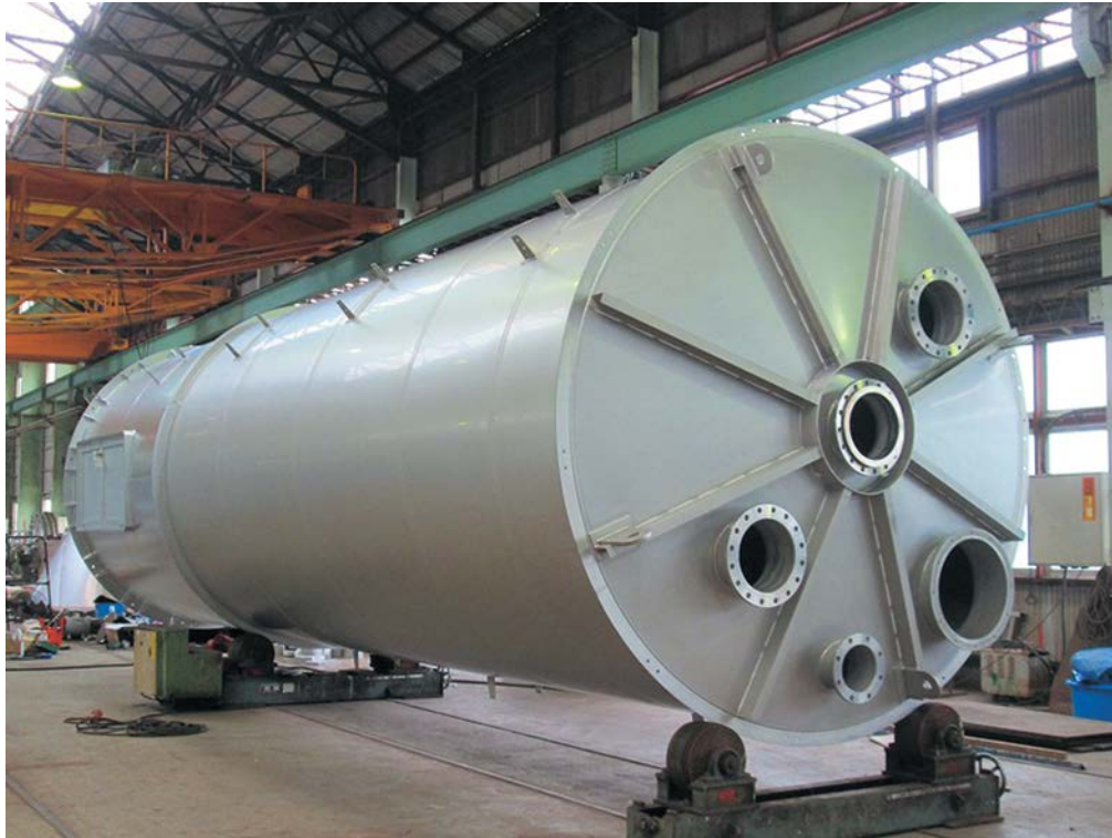
40m3サイロ1基設計製作