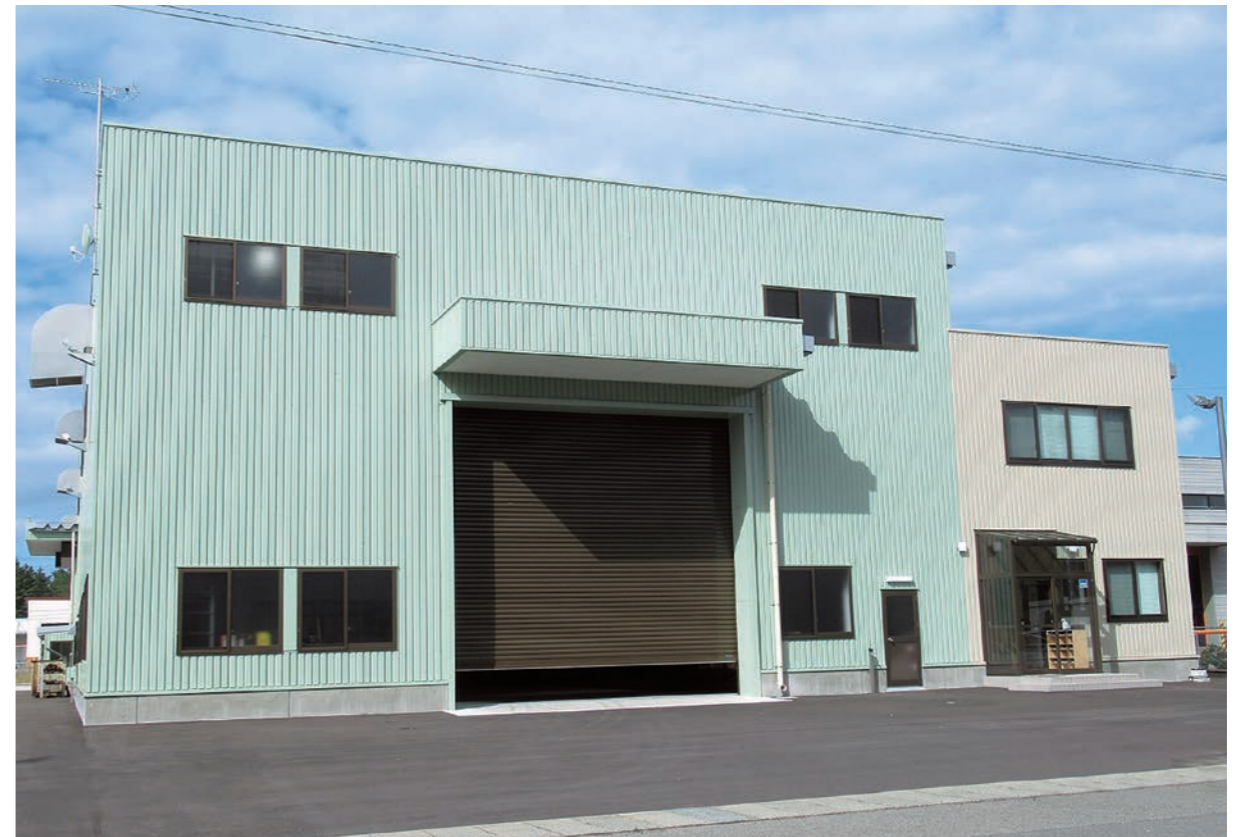
丸勝鉄工株式会社 工場新築工事