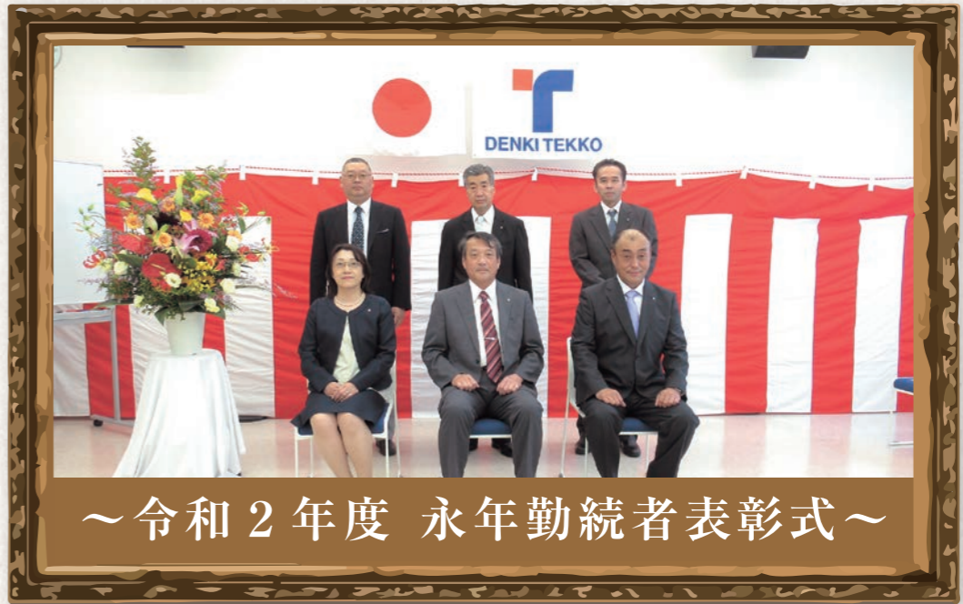
～令和2年度 永年勤続者表彰式～

7月15日、本社にて「永年勤続者表彰式」が行われ、2名の方が表彰されました。今後ますますのご健勝とご活躍を祈念いたします。今回は受賞された方々に懐かしい写真とともに思い出を語っていただきました。