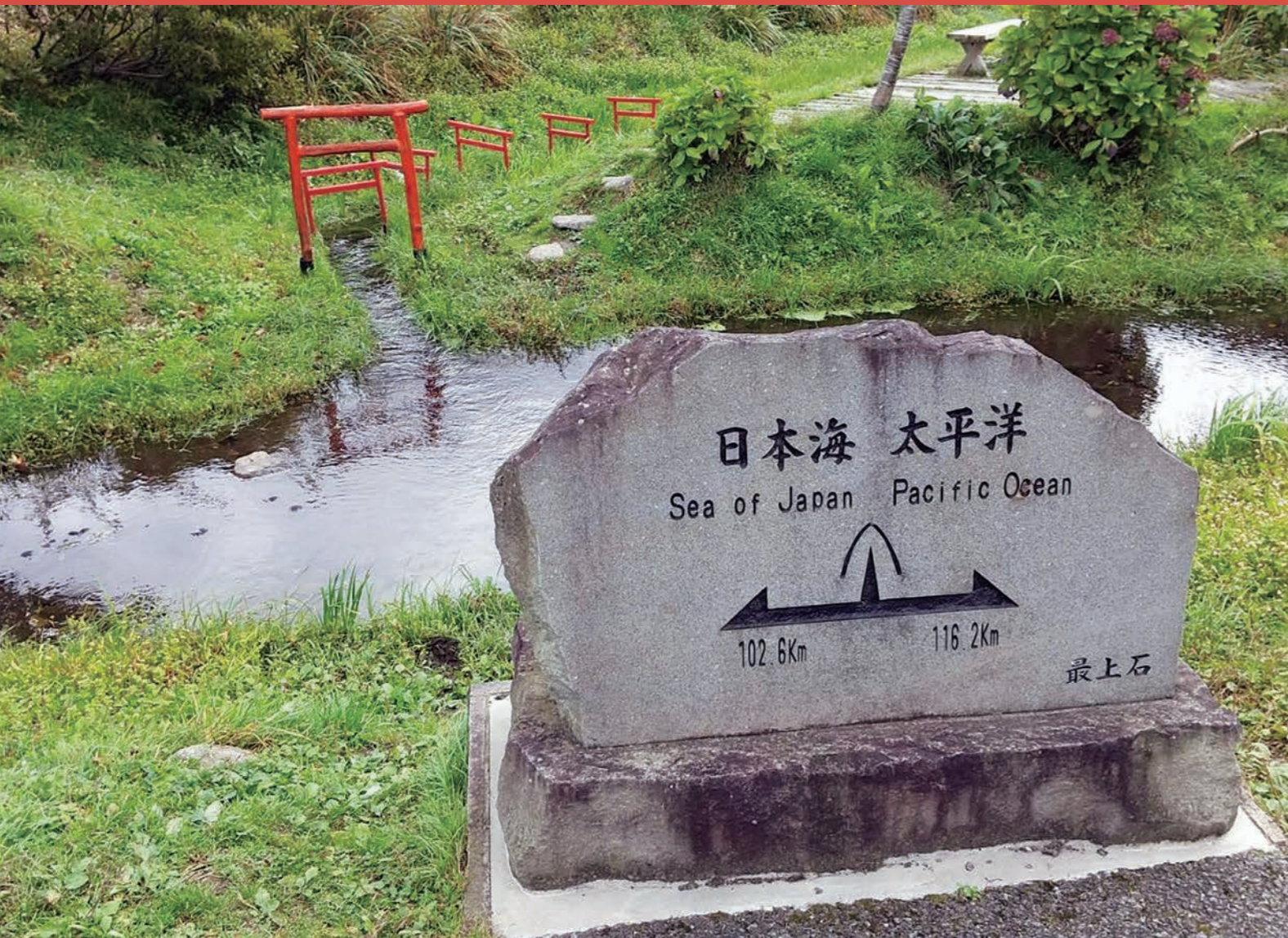
写真 / 分水嶺 (山形県最上町)