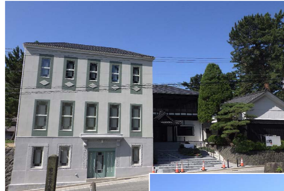
旧割烹小幡改修工事のうち 機械設備工事